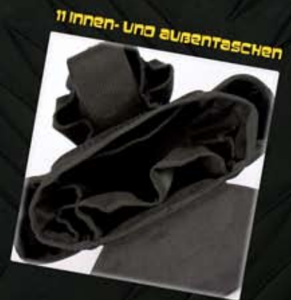
11 Innen- und Außentaschen