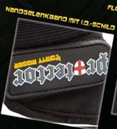
HANDGELENKBAND MIT I.O.-SCHILD